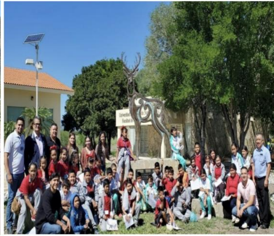
Figuras 9 y 10. Imágenes finales de grupo después de impartir el taller de germinación de semillas en la Escuela Secundaria Fortunato Zuazua, Galeana, N.L. y visita al JB-EHX.