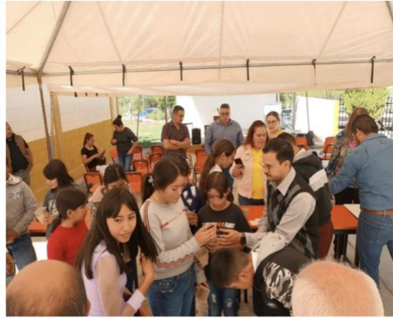
Figuras 5 y 6. Recorrido en el JB-EHX y parte práctica del taller de germinación de semillas impartida a estudiantes de la Escuela Secundaria Fortunato Zuazua, Galeana, N.L.