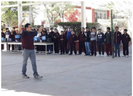
Figuras 3 y 4. Conferencia ambiental previo a recorrido por el JB-EHX y charla previa a la impartición del taller de germinación en el auditorio de la FCF-UANL y en la Escuela Secundaria Jesús Reyes Heróles; en la localidad El Derramadero, Galeana, N.L.