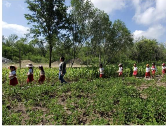
Figura 5 y 6. Recorridos realizados con la participación de niños de distintas escuelas en el programa de educación ambiental.