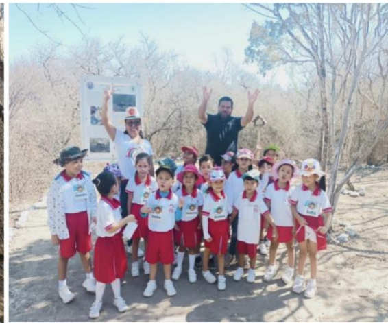
Figuras 11 y 12. Imágenes de estudiantes de las escuelas Sebastián Villegas Cumplido y Emiliano Zapata, Linares, N.L., recorriendo la sección Etnobiológica del JB-EHX.