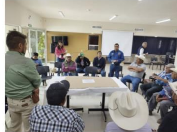
Conferencias y dinámica de grupos participativos