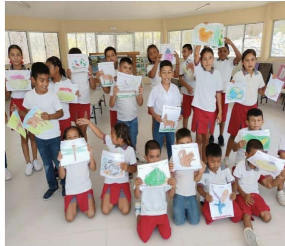
Figuras 7 y 8. Actividades didácticas puestas en práctica en el JB-EHX a niños de la escuela primaria Álvaro Obregón localizada en el Refugio Veredas, Linares, N.L.