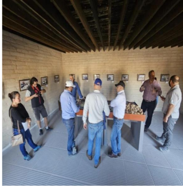
Figuras 1 y 2. Recorrido por vivero de reproducción de plantas y área de conocimientos ancestrales y de procesamiento y extracción de la cera de candelilla.