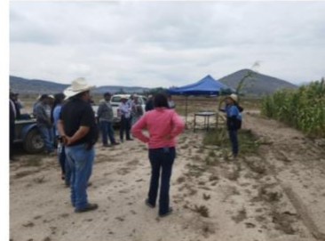
Recorrido de campo para observar maíces nativos