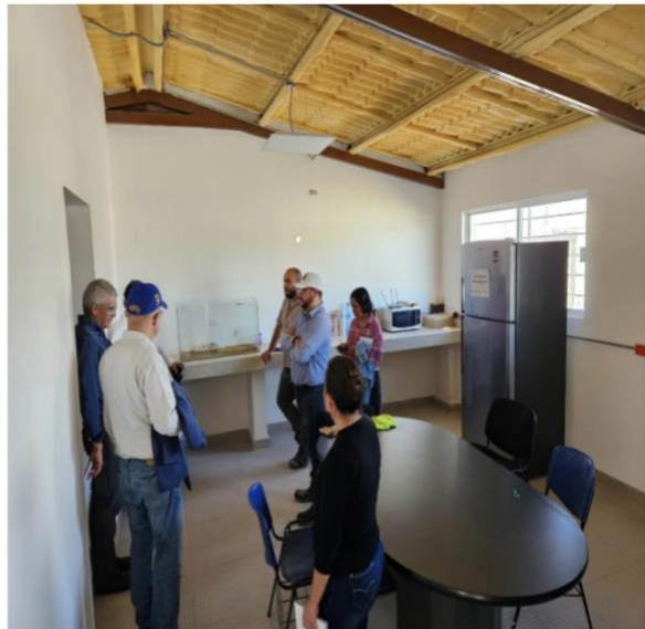
Figuras 3 y 4. Área de exposición de cactáceas y laboratorio de cultivo de tejidos y banco de semillas.