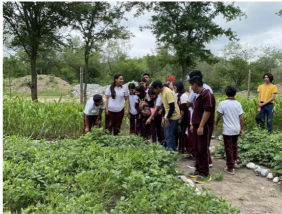
Figura 7 y 8. Estudiantes de educación básica y madres de familia recibiendo información del personal técnico del Jardín Botánico durante los recorridos por las áreas de cultivo.