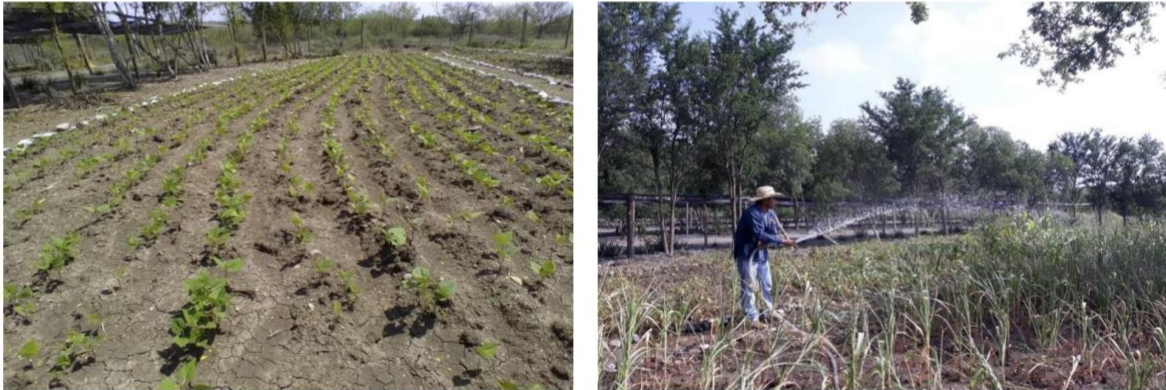
Figura 3 y 4. En la imagen de la izquierda se pueden observar plantas de frijol en pleno crecimiento. A la derecha se aprecia el riego auxiliar, necesario para el adecuado desarrollo de los cultivos.