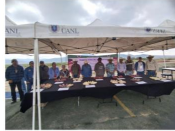
Entrega de premios y participantes en el evento