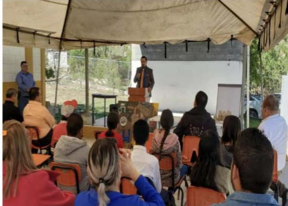
Figuras 1 y 2. Inauguración de Programa de Responsabilidad Social Ambiental en la FCF-UANL y en Galeana, N.L. por parte de responsable del proyecto y encargado de la Unidad Regional 7 de la Secretaría de Educación de N.L., en el auditorio de la FCF-UANL y en la Escuela Secundaria Fortunato Zuazua, localidad La Cruz, Galeana, Nuevo León.