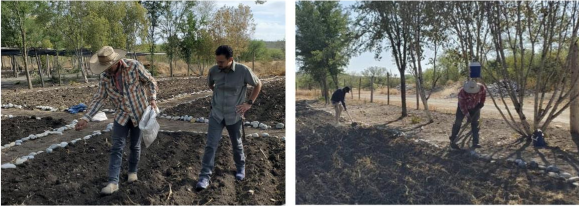
Figura 1 y 2. Preparación del área demostrativa con cultivos regionales en la sección Etnobiológica; se observa a los trabajadores, vecinos de localidades aledañas al jardín botánico, preparando los surcos y sembrando frijol y maíz.